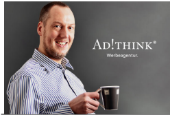
Marketing-Berater, Ghostwriter, Social Media-Trainer und Inhaber der Ad!Think Werbeagentur in Nürnberg.

Ich bin seit 1992 als Werbekaufmann tätig und habe 1999 die Ad!Think Werbeagentur gegründet. Seit 2006 liegt mein Schwerpunkt auf der strategischen und Medien-übergreifenden Marketing-Beratung mit starkem Fokus auf der Integration von Online- und Social Media-Marketing. Hierbei berücksichtige ich die Erkenntnisse der Gehirn-Forschung und gebe seit 2008 auch Seminare.